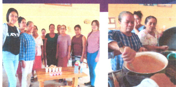
Elaboración de jabones artesanales

-TRANSFORMANDO nuestro municipio en una nueva historia-